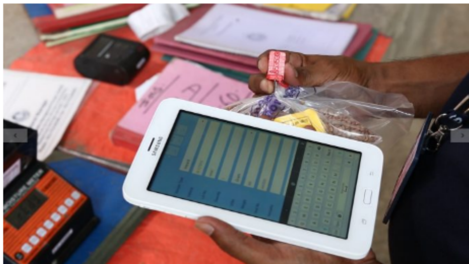
SLCM gets European grant for AI/ML-based quality app

The New Delhi headquartered agri technology and warehousing solutions conglomerate Sohan Lal Commodity Management (SLCM) has received a technical assistance grant of EUR 125,901 (Rs 1.11 crore) from the Technical Assistance Facility of Incofin agRIF fund (agTAF) and the Smallholder Safety Net Upscaling Program (SSNUP) towards the development of its quality application for food grains and pulses.